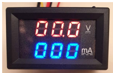
Aspect de l'afficheur