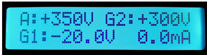
ASPECT DE L'ECRAN

Le DuoVac possède toutes les fonctionnalités d'un lampemètre conventionnel mais il utilise un mode impulsionnel qui garantit une grande sécurité au tube lors des mesures.